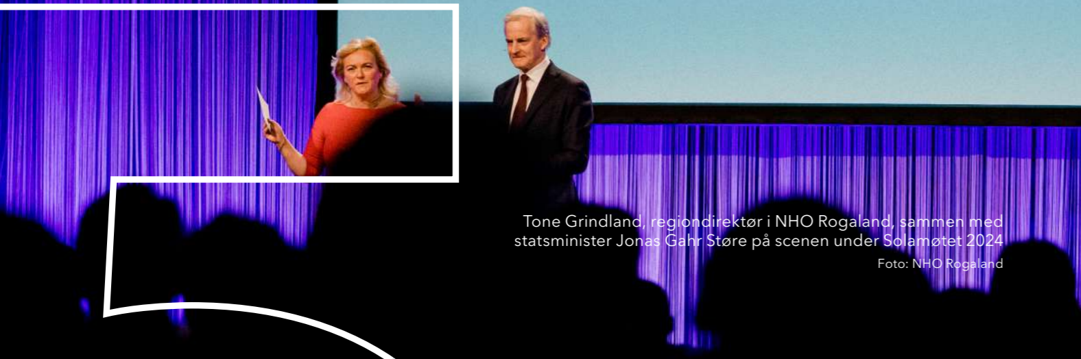
Tone Grindland, regiondirektør i NHO Rogaland, sammen med statsminister Jonas Gahr Støre på scenen under Solamøtet 2024