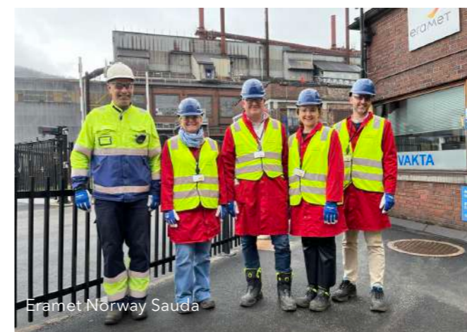
Eramet Norway Sauda

Våre medlemmer er alt fra små familieeide bedrifter til store og internasjonale selskaper. Vi har medlemsbedrifter i et stort spenn av bransjer.