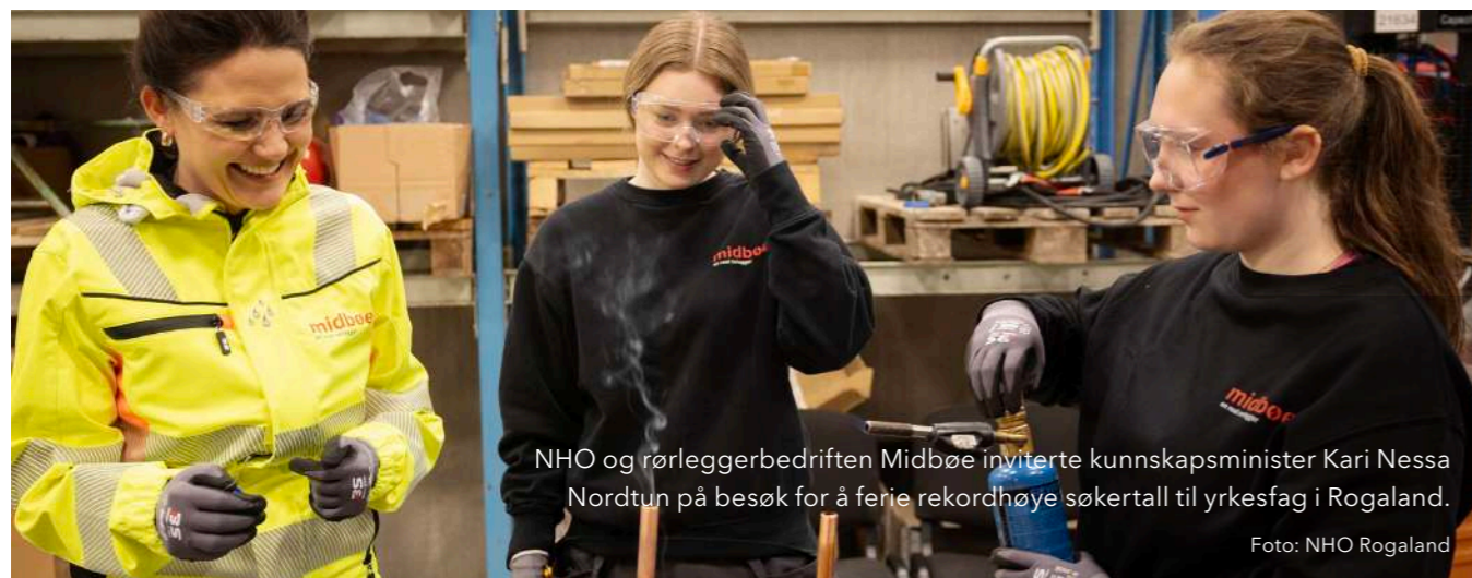
NHO og rørleggerbedriften Midbøe inviterte kunnskapsminister Kari Nessa Nordtun på besøk for å feire rekordhøye søkertall til yrkesfag i Rogaland.

NHO og næringslivet i Rogaland har stått sammen om disse prosjektene. Aldri før har vi prioritert tydeligere. Vi har valgt oss ut de strekningene som har mest å si, de som gir oss raskere og tryggere framkomst. Det er bra å se at politikerne har lyttet. Både lokale og nasjonale politikere fortjener ros.