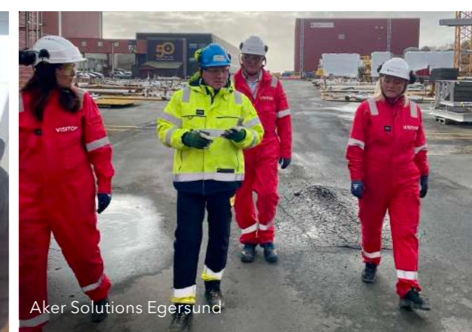
Aker Solutions Egersund