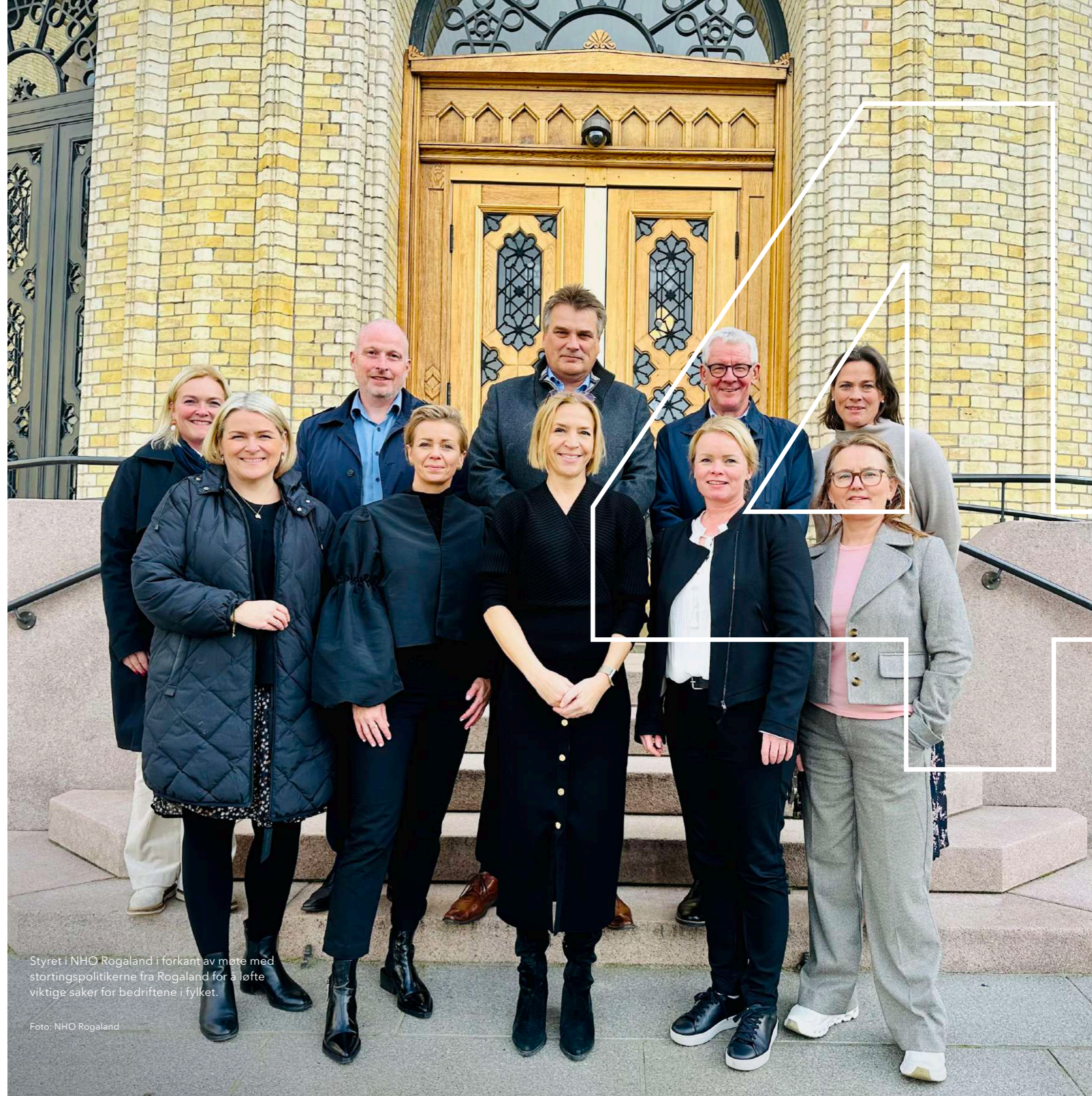
Styret i NHO Rogaland i forkant av møte med stortingspolitikere fra Rogaland for å løfte viktige saker for bedriftene i fylket.

Vi har påvirket viktige prosesser og bidratt til at politikerne prioriterer forhold som direkte påvirker våre medlems-bedrifter.