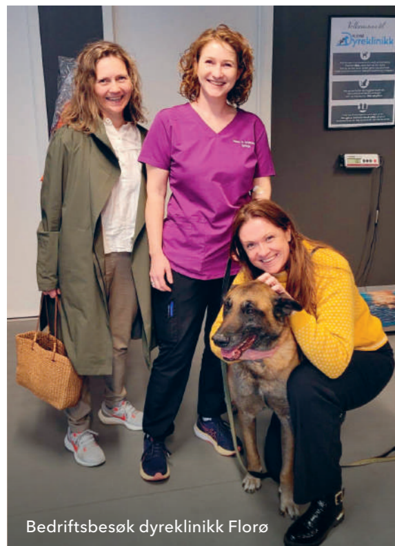
Bedriftsbesøk dyreklinikk Florø