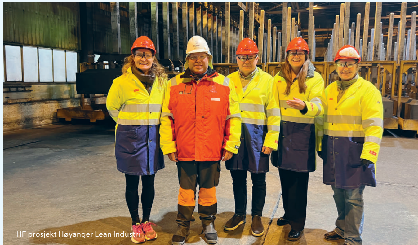
HF prosjekt Høyanger Lean Industri

Alle medlemmar kan søke om støtte frå HF, men det føreset at bedrifta er bunden av tariffavtale og at hovudavtalen mellom NHO og LO gjeld for bedrifta.