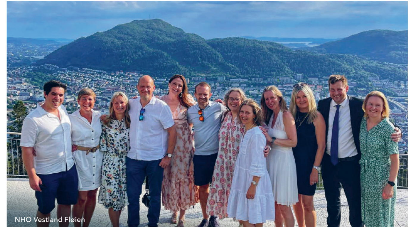
NHO Vestland Fløien