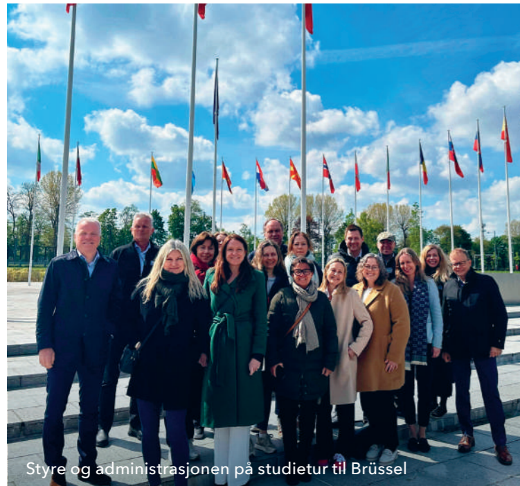
Styre og administrasjonen på studietur til Brussel