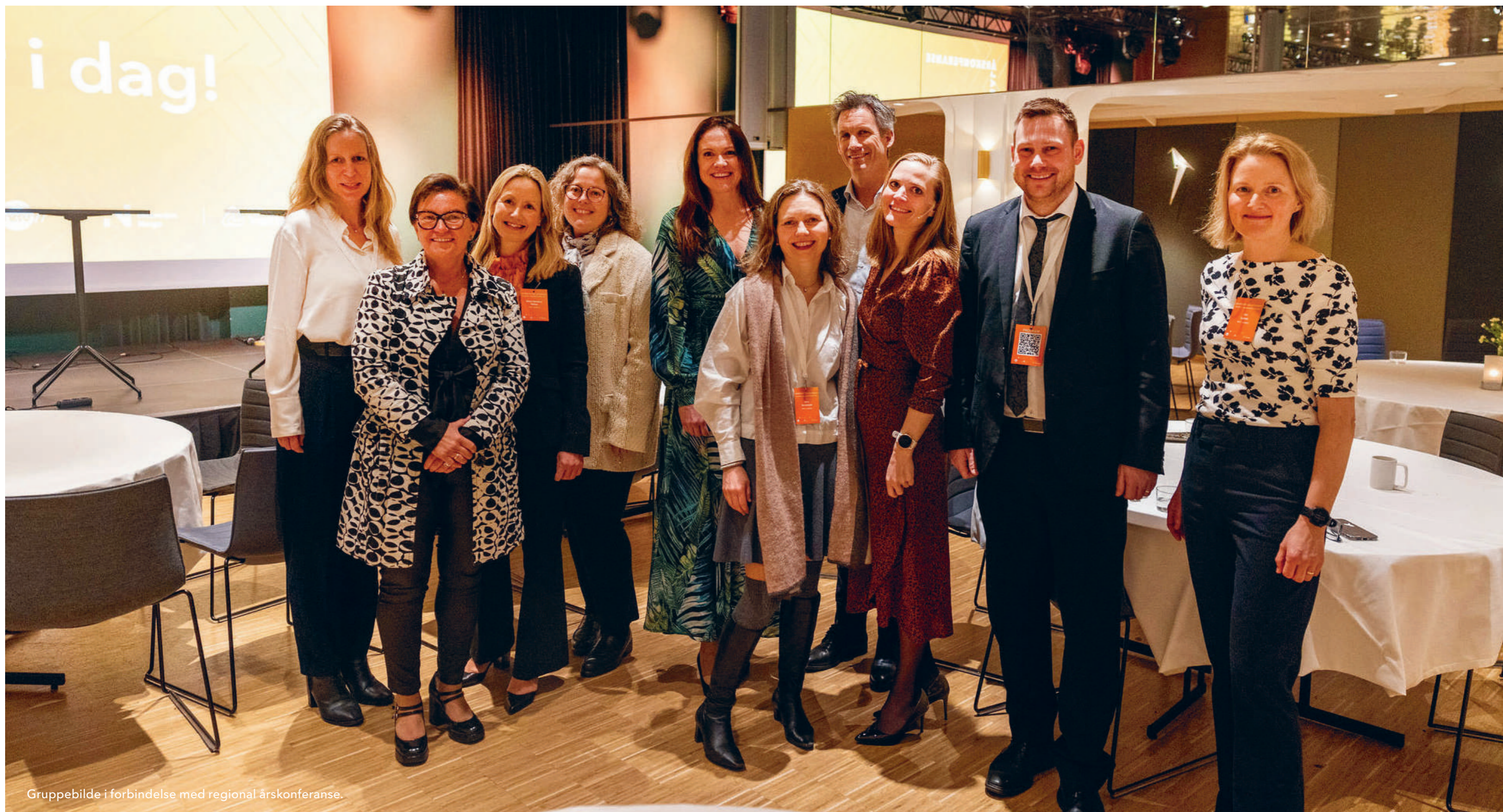
Gruppebilde i forbindelse med regional årskonferanse.