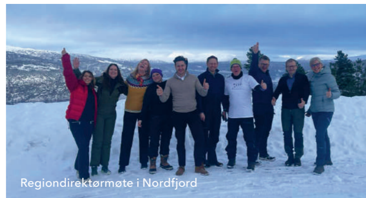
Regiondirektørmøte i Nordfjord